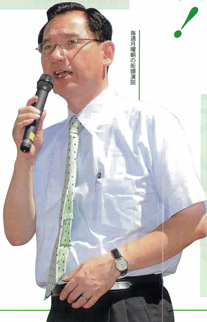
毎週月曜朝の街頭演説