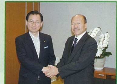
国際移住機関(イ・オ・ム) ウィリアム・パリガ駐日代表と 8月12日(木)