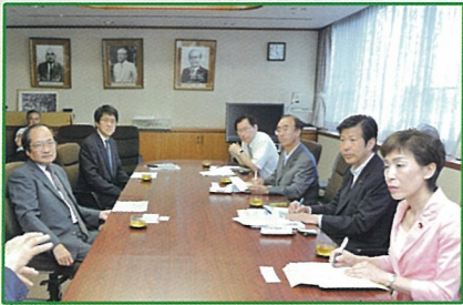
公明党 うつ対策ワーキングチーム(事務局長) 8月23日(月)