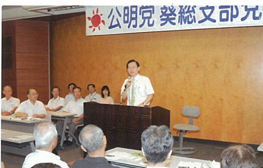
静岡市葵総支部党員会 9月2日(木)

新たな「ねじれ」国会で、いよいよ第三勢力がリードする政治へ。浜田まさよし、日本の政治を変えていきます。