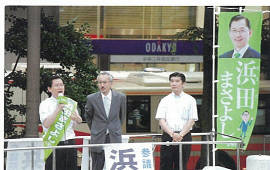
夜回り先生・水谷修氏との共同街頭 7月4日(日)