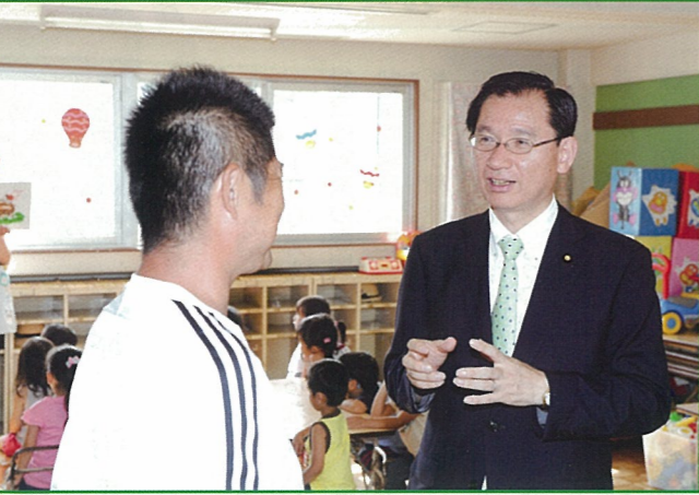
大和市モミヤマ幼稚園を視察 7月20日(火)