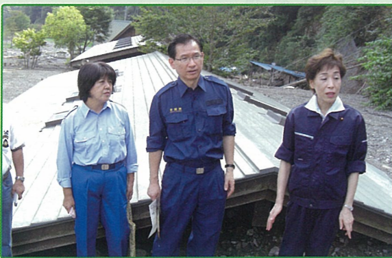
公明党 神奈川県本部災害対策本部 9月11日(土)