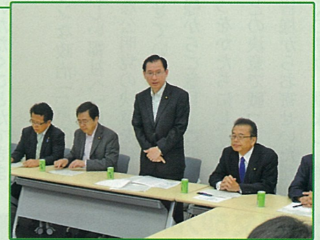
公明党・核廃絶推進委員会(座長) 7月30日(金)

インドへの原子力発電の技術や機材を輸出するために 必要な「日インド原子力協定」締結交渉をめぐる動向に ついて外務省、核廃絶運動を進めるNGO団体の方々と 意見交換をしました。核廃絶に向けて推進して参ります。