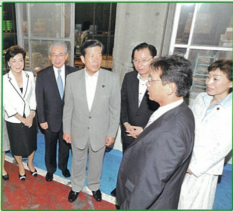
公明党 中小企業活性化対策本部(事務局長) 8月25日(水)

また、記録的な豪雨で土砂崩れなど の被害が発生した神奈川県山北町の被 害現場を視察。一日も早い復旧に向け て取り組んで参ります。