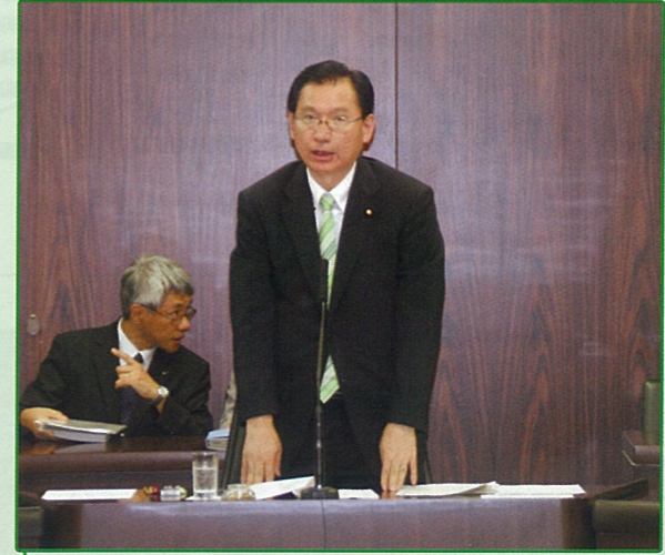
法務委員会での就任あいさつ 8月6日(金)

7月30日、参議院選挙の結果を受けた与野党 伯仲の中で、臨時国会が開会されました。 参議院本会議の席上、法務委員長に選任されま した。国民生活に密接な民法や刑法、さらには企 業活動の根幹を成す会社法など我が国法制度を審 議するほか、裁判員制度などの司法改革も担当し