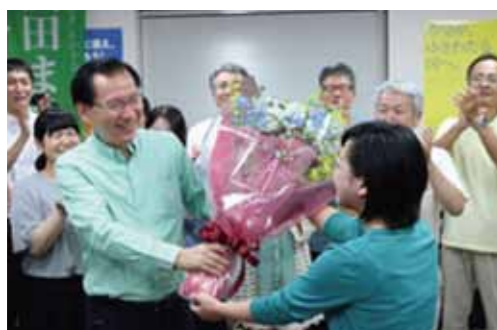
静岡市内・選挙事務所 7月10日