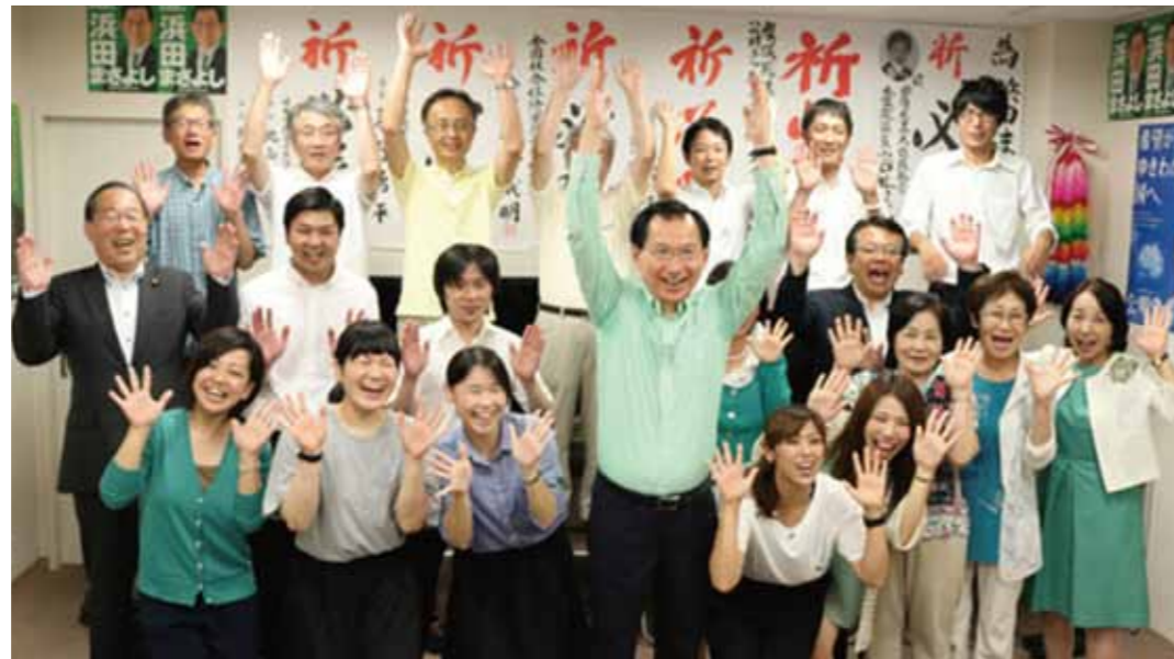
静岡市内・選挙事務所 7月10日