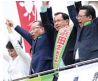
静岡市・青葉イベント広場 6月22日