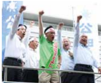
石川県金沢市・めいてつエムザ前 7月5日