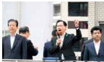
愛知県・尾張一宮駅前 5月3日