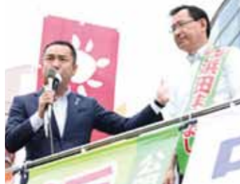
三重県四日市市 鈴木三重県知事が応援 6月25日