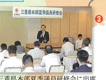
③三重県本部夏季議員研修会に出席 (紀北町) 8月21日