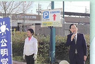
④大曽根駅前街頭遊説 (名古屋市東区) 12月18日