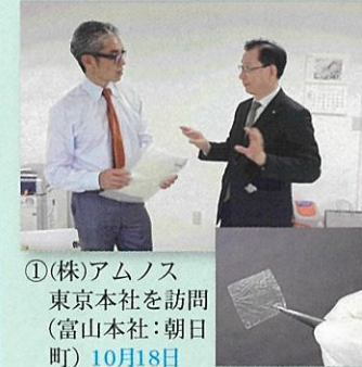
①(株)アムノス 東京本社を訪問 (富山本社:朝日町) 10月18日

9月1日、富山大学発のベンチャー企業が、経済産業省の補助金を契機に、朝日町に乾燥羊膜の製造工場の建設計画を発表。角膜や脳硬膜の欠損部の修復を行う再生医療で、17年4月の完成を目指し、18年から米国で、20年を目途に国内販売を目指す計画です。