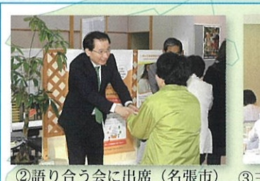
②語り合う会に出席 (名張市) 11月23日