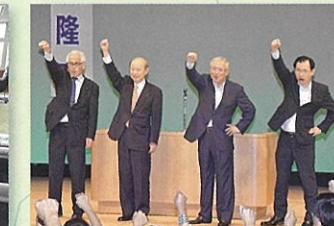
④富山県本部時局講演会に出席 (富山市内) 9月22日