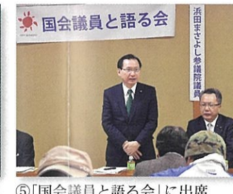
⑤「国会議員と語る会」に出席 (菅島町) 12月3日