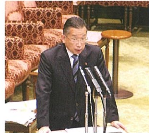
山本有二農林水産大臣