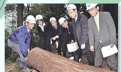
①天竜杉の林業木材産業の現場視察 (浜松市) 10月29日

環境に配慮し、適切に森林管理されていることを保証する、FSCの認証面積が日本一の、浜松市天竜地区を視察させて頂きました。11月14日のTPP特別委員会でも、官民一体となった認証材・製品の普及促進を取り上げ、農林大臣から、「普及促進に取り組んでいく」との答弁を引き出しました。