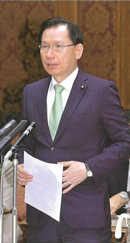
参院TPP特別委員会総括質疑 11月14日