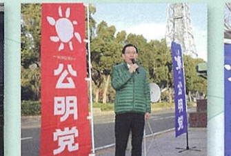
③オアシス21前で街頭遊説 (名古屋市東区) 12月19日