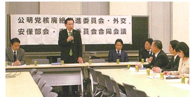
公明党核廃絶推進委員会等合同会議に出席 11月9日

核兵器禁止条約を17年3月から交渉開始するという国連決議。その性急さ故に、米、英、仏、露、中、インド、パキスタン等の核保有国の参加も見込めず、我が国は反対票を投じましたが、公明党の強い主張により、交渉には参加することに。唯一の戦争被爆国として、核保有国と非保有国の橋渡しの役割を政府に求めて参ります。