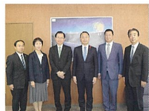
④石川県金沢市長を表敬訪問 (金沢市) 10月14日

地域の雇用創出を目指す能登中核工業団地において、不燃材の加圧含浸による不燃木材の製造に取り組む、地元木材メーカーを視察させて頂きました。木造の中層建物などの用途拡大により、東海北陸の林産資源の高度利用を進めて参ります。