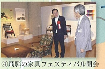
④飛騨の家具フェスティバル開会式に出席、挨拶 (高山市) 9月7日