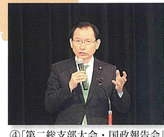
④「第二総支部大会・国政報告会」に出席 (四日市市) 11月23日