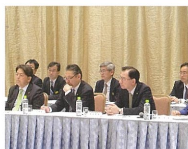
帯広地方公聴会 11月17日

平洋に開かれた経済圏を築いていくことが必須です。今後のRCEPやFTAAPのルールのモデルとなるのが、まさにTPP。「21世紀型経済連携協定」で日本の成長戦略、さらに進めて参ります。