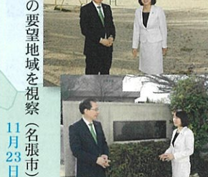
①バス増便の要望地域を視察 (名張市) 11月23日

名張市の小中学校の子ども達が登校時に利用する路線バスでは、年々利用者が増加し、満員で危険なため、バス増便の要望活動を続けているとのご相談を頂きました。直ぐに地方創生推進交付金の申請を提案し、市長、教育委員会と話し合いを進めていく中、バス会社から連絡があり、増便されることが決まりました。