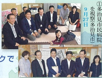
①多治見市市民病院を視察(多治見市) 9月27日

医療ケアが必要な重症心身障がい児・者を一時的に預かる「医療短期入所事業」を実施する多治見市市民病院とNPO在宅支援グループ「みんなの手」を視察させて頂きました。来年度以降も継続して実施していただけるよう、国・県・市のネットワークで取り組んで参ります。