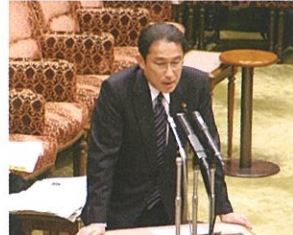
岸田文雄外務大臣