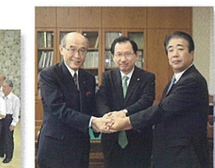
③石川県知事を表敬訪問 (金沢市) 10月14日