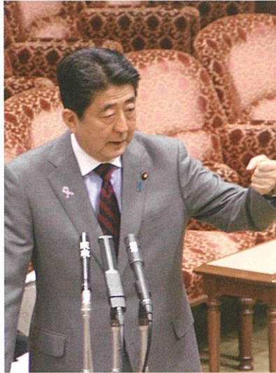
安倍晋三内閣総理大臣 11月14日