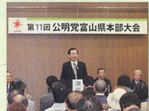
②富山県本部大会に出席 (富山市内) 10月15日