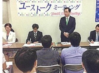
③静岡ユーストークミーティングに出席 (静岡市) 10月3日