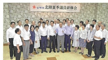
②北陸夏季議員研修会に出席 (志賀町) 8月27日