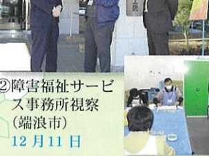
②障害福祉サービス事務所視察 (端浪市) 12月11日