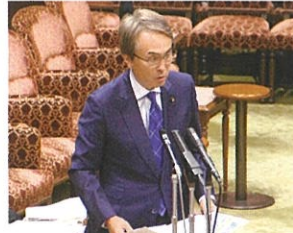
石原伸晃TPP担当大臣