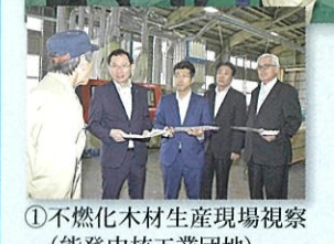
①不燃化木材生産現場視察 (能登中核工業団地) 8月27日