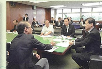
③黒部市長の石井国交大臣への要望に同席(国交省) 8月2日