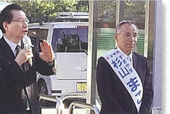
②伊豆市議選で街頭遊説 (伊豆市) 10月16日

環境に配慮し、適切に森林管理されていることを保証する、FSCの認証面積が日本一の、浜松市天竜地区を視察させて頂きました。11月14日のTPP特別委員会でも、官民一体となった認証材・製品の普及促進を取り上げ、農林大臣から、「普及促進に取り組んでいく」との答弁を引き出しました。