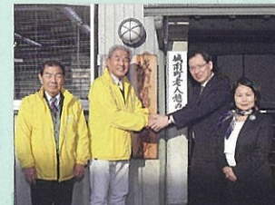
②城南町自主防災会の皆様と懇談(安城市) 12月18日