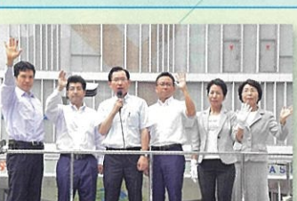
①終戦記念日街頭 (名古屋市) 8月13日

11月から愛知県本部の総支部を順番に入らせて頂いています。11月は西尾市、12月は安城市で街頭遊説や地元の皆様との懇談会に。1月からは公明党議員「空白区」の名古屋市東区も担当させて頂き、街頭遊説や支部会などで公明の戦いを皆さまにお伝えさせて頂きます。