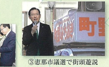
③恵那市議選で街頭遊説 (恵那市) 11月6日